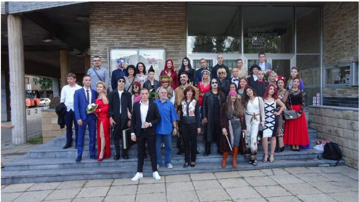
Окупљање испред Народног позоришта и славље у ресторану Александар