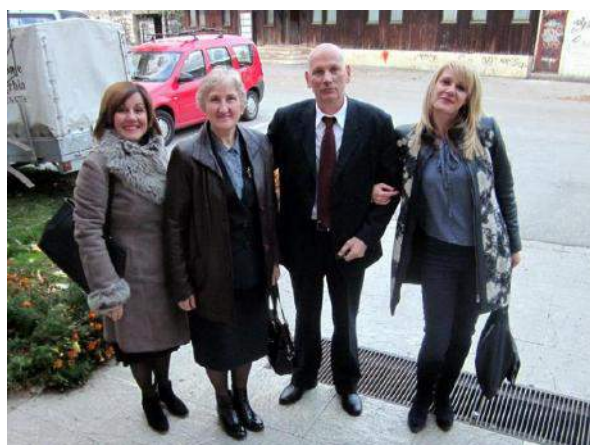
31.10. Прослављена школска слава - Свети Лука